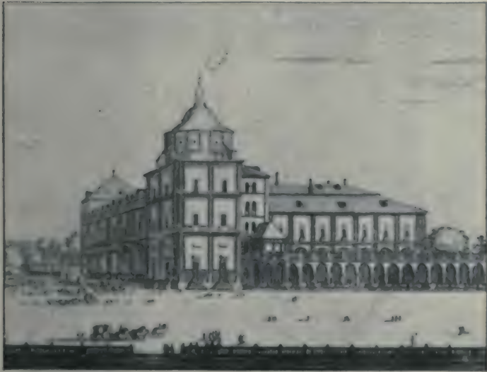
Vue du Palais d'Aranjuez.

n'était point un sot, car c'est lui qui prit l'initiative de faire creuser le canal impérial d'Aragon, faisait une cour assidue à la duchesse d'Albe. Celle-ci ne s'était mêlée jusque-là